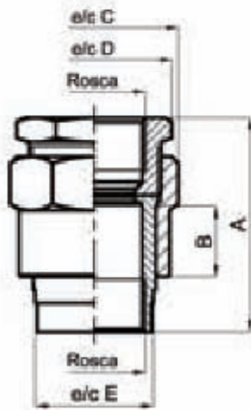
EXUMBHH / EXUMCHH

Las dimensiones y pesos son aproximados y comunes a ambos tipos de roscas.