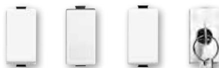
AM5003 AM5003A AM5003L AM5003AL AM5012 AM5007 - AM5007C AM5007D - AM5007DC