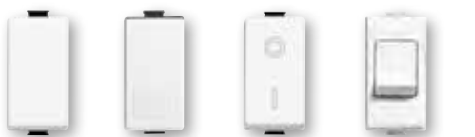
AM5001 AM5001A AM5001L AM5001AL AM5011 AM5011/32